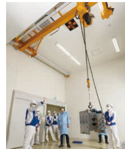
株式会社シード様で開催した クレーン特別教育の様子

製品の正しい使い方や、メンテナンス講習会などを実施しています。耐久性に優れた製品は、正しい使用方法と定期的なメンテナンスで製品寿命も高まり、結果として、産業廃棄物の削減にもつながります。