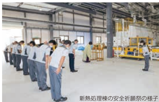
新熱処理棟の安全祈願祭の様子

真空浸炭炉を採用した新しい熱処理ラインは、火災のリスクも低く、保温のためのムダな待機電力も不要になります。安全な作業環境が整うだけでなく、環境にもやさしい設備です。